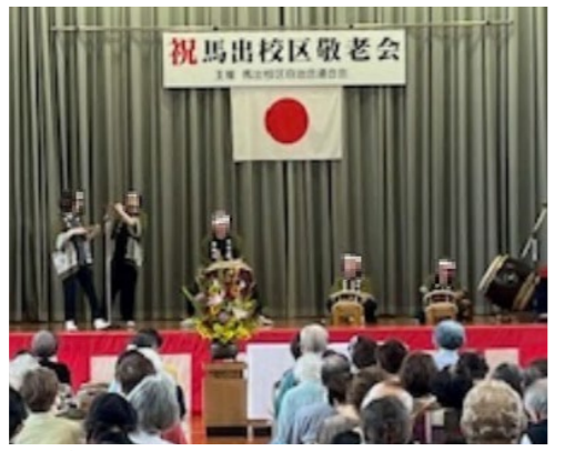
広い会場に200人が集い、催しを楽しみます