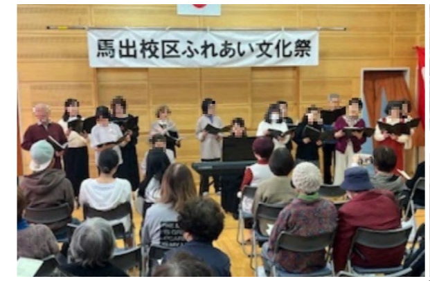
舞踏や合唱、音楽演奏など見ごたえあるステージ発表

例年9月、校区にお住まいの75歳以上の方を招き、馬出小学校の体育館で敬老会が盛大に開かれます。毎年約200人が参加し、地域ぐるみで長寿を祝う、あたたかな交流の場です。ステージでの楽しい出し物や大抽選会が行われ、笑顔あふれるひとときとなっています。