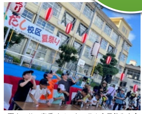
夏まつりの定番イベント、ラムネ早飲み大会