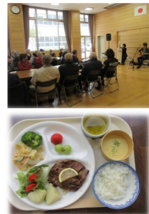
食事を囲んで会話が弾みます

校区在住の70歳以上の一人暮らしの方と年齢合計80歳以上のご夫婦を公民館に招き、男女共同参画協議会の手作り料理で食事会を催します。会では食事に加え、音楽鑑賞なども行い、交流を深めながら和やかなひとときを過ごします。