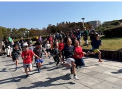
校区青少年育成連合会の主催イベント

馬出校区の年末恒例、もちつき大会。薪のかまどでもち米を蒸し、子どもも大人も杵を手に餅をつきます。石臼でついた餅は艶やかでやわらかく、きなこやあんこ、大根おろしなど、いろいろなトッピングで楽しめます。