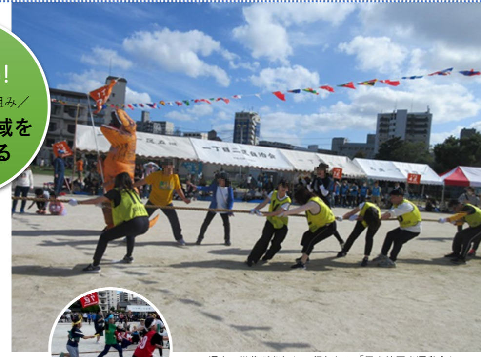
幅広い世代が参加して行われる「馬出校区大運動会」