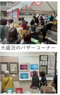
大盛況のバザーコーナー 地域の方の力作が並びます