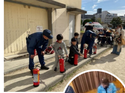
災害時の行動をイメージできる体験型の訓練

馬出校区では、自主防災会が中心となり校区防災訓練を毎年実施しています。東消防署や東消防団馬出分団をはじめとする関係機関の協力を得て、2024年度は「家族みんなで防災体験」、2025年度は「DIG（災害図上）訓練」をテーマに取り組みました。