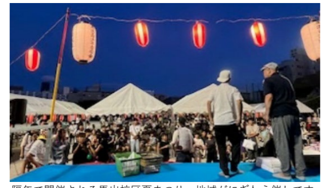
隔年で開催される馬出校区夏まつり。地域がにぎわう催しです