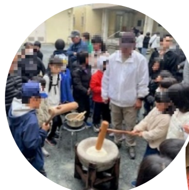
昔ながらのもちつきを体験