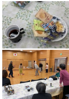
喫茶コーナーでくつろげます

毎月第1・3月曜日の13時から15時に馬出公民館で開かれる地域カフェ。お茶やコーヒーを飲みながらのおしゃべりがメインの日と、ポッチャを行う日があるほか、インボディ（体成分分析測定）を年3回行っています。参加無料。