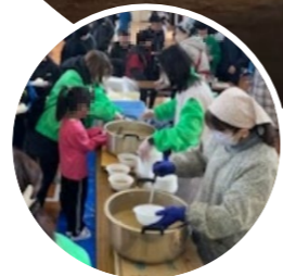
マラソン大会の後の楽しみ、豚汁とおにぎり

馬出校区の小中学生が参加するマラソン大会。男女別に低学年・高学年に分かれ、東公園を元気いっぱいに走ります。表彰式の後には、がんばった子どもたちに豚汁とおにぎりがふるまわれ、温かい食事で体も心もあたたまります。