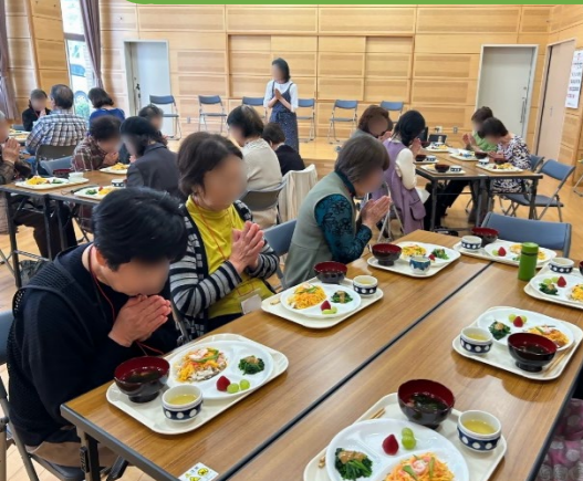
事前申し込み不要で、気軽に参加できます

校区在住の70歳以上の方を対象に、毎月第4月曜日の午前10時から正午まで、馬出公民館で開催。音楽や映画鑑賞、健康体操など月替わりの催しと手作りの食事を楽しみながら、和やかな雰囲気の中で交流が広がります。会費200円。