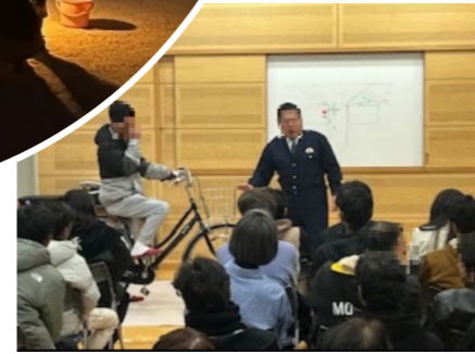
身近な事例を交えて安全のイントを紹介

校区交通安全推進協議会と交通安全協会では、年に2回、校区住民のみなさんを対象に「交通安全講習会」を開催しています。講習会では、自転車の交通ルールや特殊詐欺の手口についてなど毎回テーマを替えて、東警察署の警察官がわかりやすく解説してくれます。