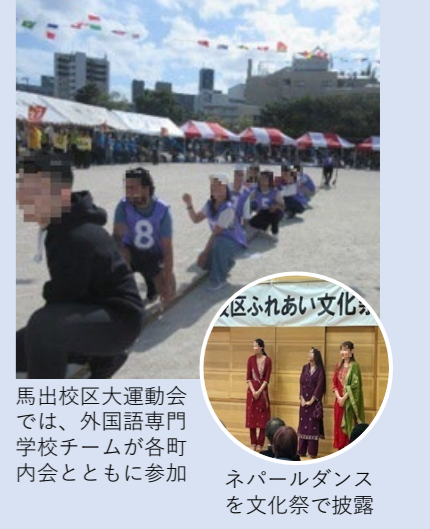
馬出校区大運動会では、外国語専門学校チームが各町内会とともに参加 ネパールダンスを文化祭で披露

馬出校区内には外国語専門学校や日本語学校があり、外国人学生や先生も地域行事に参加し、住民との交流を深めています。校区大運動会では、福岡外国語専門学校の学生がチームを編成し、リレーや綱引きなどの町内対抗種目に出場。また、夏まつりや文化祭で芸能を披露したり、ねんりんクラブのカラオケ大会に出演したりと、さまざまな場面で地域に親しみ、交流の輪を広げています。