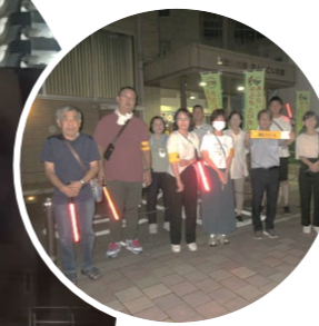
毎月の夜間パトロールは、どなたでも参加できます

地域を守ろう会では、毎月15日、夜間パトロールを行っています。夜8時から30分ほど公民館周辺を中心に校区内を巡回。さらに夏休みと放生会開催時、年末には、校区青少年育成連合会と小中学校のPTA・教職員が合同でパトロールを実施し、安心して暮らせる地域づくりに取り組んでいます。