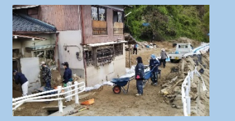
豪雨被災地での復興支援活動

近年頻発する自然災害。九州でも熊本地震災害、福岡朝倉地区・佐賀武雄地区の豪雨災害などが記憶に新しいところです。美和台校区では、県内外の被災地に対する支援活動を継続的に行っており、物資の提供や義援金、人材派遣による支援のほか、被災地産品の販売に協力するなどしています。