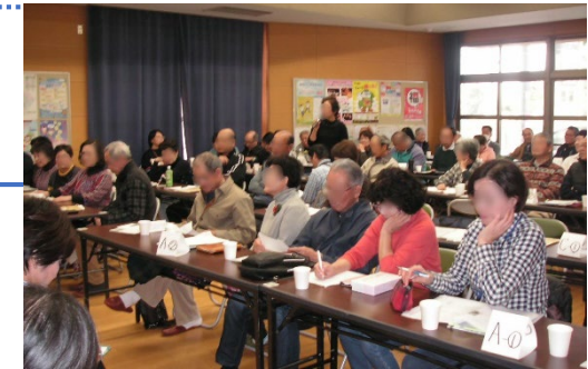
定期的に行われる「ふれあいネットワーク研修会」