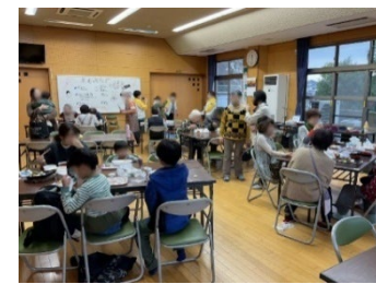
「住民の居場所づくり」を目標に2018年から始まった「えむぶらざ」