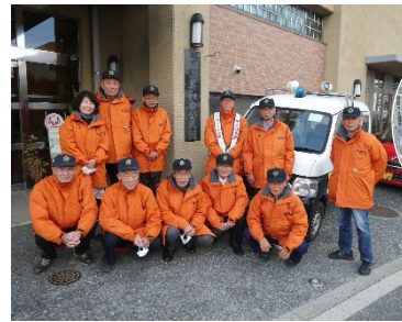
パトロールなど日夜活動する自警団

地域の安全・安心を守るため、美和台校区自警団、防犯組合、交通安全推進委員などが連携して、さまざまな活動を行っています。小学校入学時の登下校の交通安全指導や週3日ほどの下校パトロール、月2回の夜間パトロール、行事時の交通整理のほか、不審者情報が入った際など青パト巡回による注意喚起を行っています。