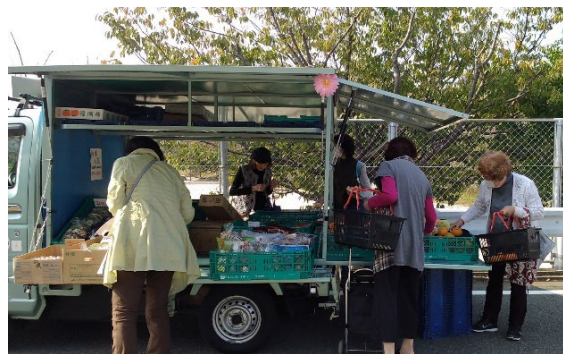
坂の多い町に笑顔を届ける 移動販売

美和台校区は東区の北側に位置し、昭和40年代から開発が進められた戸建て中心の住宅地が広がります。小高い丘を切り広げて造成された土地のため、坂道が多いのが特色。住民の高齢化が進む一方、マンション開発で新しく転居してきた子育て世代も増えており、住民同士の絆を深める地域活動が活発な校区です。