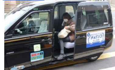
乗り降りしやすい車両