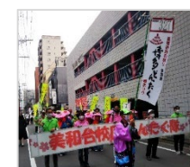
校区で参加は東区唯一

毎年5月3・4日に開催される「博多どんたく港まつり」。その目玉となるパレードに、美和台校区は2010年から参加。校区どんたく隊を結成し、美和台音頭を踊って博多の街を行進します。