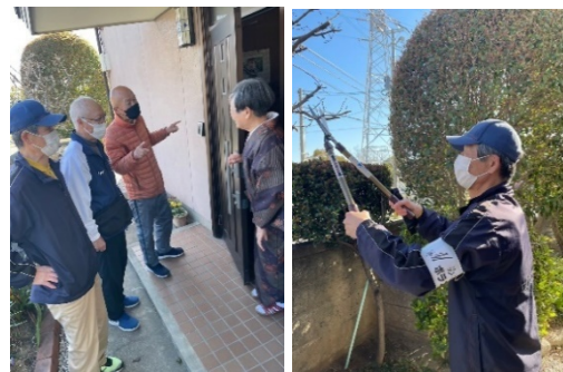
好きなこと得意なことを活かしてボランティア

2022年に発足した「みわだいボランティアの会」は、住民の困りごとを解決するため、校区内のボランティアができる人とボランティアを利用したい人の橋渡しをしています。また、複数のボランティア団体とも連携を図りながら、地域の人材を活かしたボランティアネットワークを広げ、活動参加者を増やすための交流会や養成講座も実施しています。