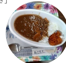
メニューは定番のカレーと月替わりのお弁当。子ども100円、大人300円で持ち帰りも可