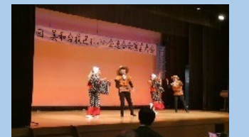
長年続く「美和台校区演芸大会」

校区に住む60歳以上の方が会員となる老人クラブ。演芸大会やカラオケ大会、スポーツイベント、三社参りなど生活や地域のつながりを豊かにする多彩な活動をしています。