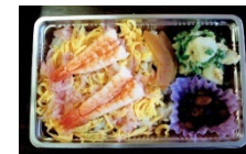
お一人暮らし 弁当配布 (ちらし寿司)

支援が必要と思われる世帯を近隣の住民が見守り、支え合う活動。美和台校区では、校区社会福祉協議会・民生児童委員・地域ボランティアのおよそ100名で活動しており、見守りや声掛け訪問を行っています。