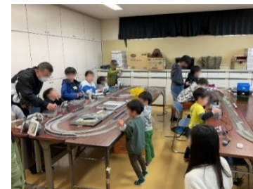
子どもたちに大人気の鉄道模型(Nゲージ)の運転会