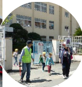
小学校の登下校 交通安全指導