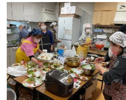
調理ボランティアのみなさんが食事を提供