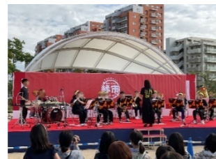
城香中学校吹奏楽部の演奏

2022年から始まった香椎浜校区の秋祭り。「ご近所同士の縁をつなぐ祭りになれば」という思いを込めて「縁市」と題し、例年10月に香椎浜中央公園で盛大に行われます。広々とした会場には、地元店舗やサークル団体など地域の方たちの協力による縁日やマーケットが並び、多彩なメニューのキッチンカーがずらり出店。イベントステージでは吹奏楽やダンスのパフォーマンスが披露され、多くの人でにぎわいます。