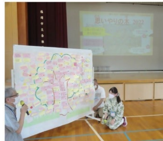
外国人が香椎浜校区に住んでみて感じたことが書かれた「思いやりの木」、言葉で思いを伝えることが大切

外国人が多く住む香椎浜校区では、多文化共生のまちづくりをめざして、年一回「国際親善交流会」が開催されます。この催しは日本人住人と外国人住人が互いに理解し、交流を深めるために2005年からはじまったもの。2022年の開催時には7か国約150名が参加して、外国のおやつのおふるまいやダンスの披露、外国人住人の思いや願いをまとめた「思いやりの木」の紹介などが行われました。