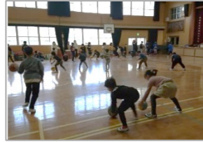
元日本代表選手をコーチに招いてのバスケットボール体験会（2023年1月）