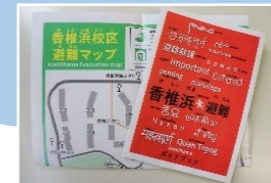
多言語表記の避難マップ

外国人住人に避難所について知ってもらうことを目的に、2019年と2020年に国際親善交流会を兼ねた防災訓練「避難所へ行こう！」を開催。訓練参加者へのアンケート結果をもとに、多言語表示の「避難所への誘導パネル」を校区9か所に設置したほか、16か国語で作成された「避難マップ」を作成するなど、外国人住民の声を取り入れた防災活動にも力を入れています。