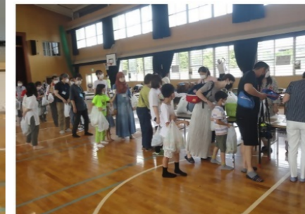
国際親善交流会で配られるお土産を受け取る際は、外国語の挨拶を交わすのがルール