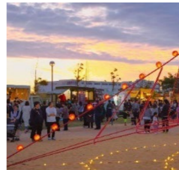
夜は遊具がライトアップされ、祭りムードが高まります