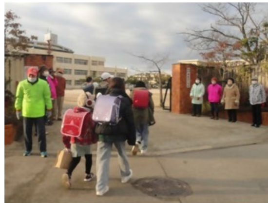
香椎浜小学校正門前での「あいさつ運動」