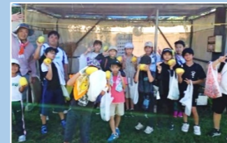
収穫物は分け合って持ち帰ります