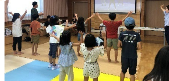
子どもたちに防災の大切さを教える「防災キャンプ」(2023年9月)