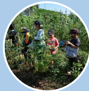
夏休みの農業体験。ミニトマト、ナス、マクワウリなどを収穫

香椎浜わくわく子ども会では、校区内にある「香椎浜ガーデン」の畑で果物や野菜を育て、地域の子どもと大人と一緒に参加できる農業体験を行っています。例年4月から12月まで季節ごとの作物を収穫。ほとんどの子どもたちが集合住宅に住む香椎浜校区では、畑で土にふれることは自然を感じる貴重な体験となっているようです。