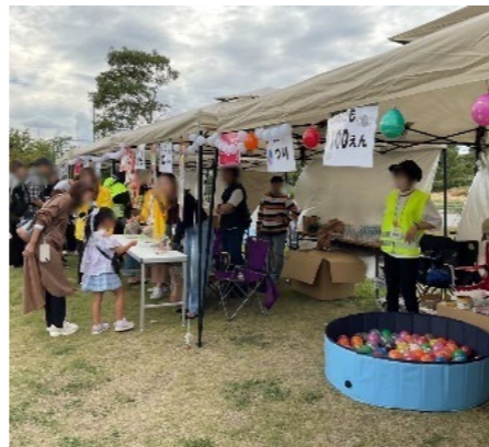
子ども会や小学校PTAなどが出店する縁日