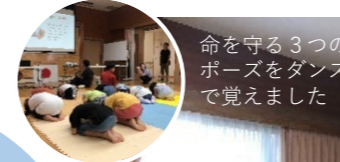
命を守る3つのポーズをダンスで覚えました