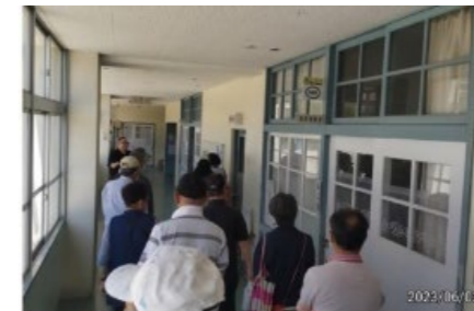
校舎内を回って避難所開設時に使われる場所を確認しました