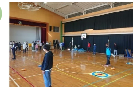
校区カローリング大会（2023年11月）

香椎浜校区スポーツ部会が中心となり、ファミリーバドミントン、グランドゴルフ、カローリングなど年間5～6種目のスポーツイベントを開催。子どもから高齢者まで幅広い世代にスポーツで交流を深めてもらおうと、2018年からはパラリンピックの正式種目であるボッチャを校区イベントに取り入れ、ニュースポーツ研修なども行っています。