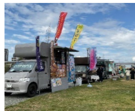
メニュー充実のキッチンカー