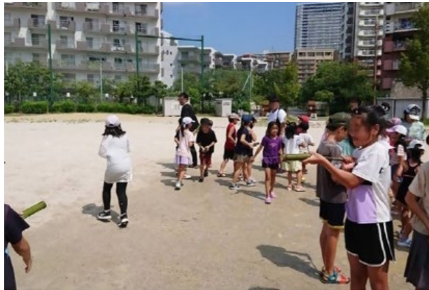
自分たちで作った竹の水鉄砲で水遊び体験（2023年8月）

「香椎浜わくわく子ども会」は校区在住のすべての子どもたちを対象とし、年間通してさまざまな活動を行っています。2023年は毎年恒例の農業体験、夏休みラジオ体操、陶芸教室、クリスマス会のほか、バスケットボール体験会や水遊び体験などを実施。大人の見守りのもと、子どもたちは地域の仲間と一緒に遊び、学校生活だけでは得られない経験をすることができます。