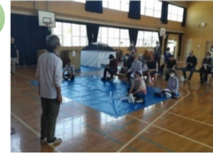
香椎浜小学校で行われた「避難所開設手順確認会」(2023年6月)

近年頻発する災害に備えて、香椎浜校区では地域ぐるみで防災活動に取り組んでいます。2023年は6月に専門部会長と自治会長を対象とした「避難所開設手順確認会」を実施しました。スムーズに避難所を開設するための作業手順をはじめ、居住区画の大きさや防災倉庫にある防災物資の内容を確認。9月には校区在住の親子が参加して日帰りの「防災キャンプ」が行われ、防災クイズやダンスなど、遊びを通して楽しく防災について学びました。