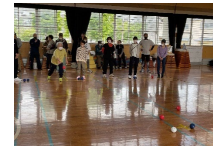
校区ボッチャ大会（2023年5月）