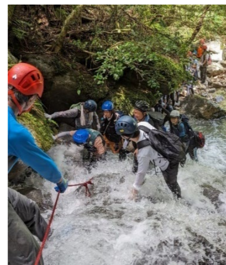
金山の坊主が滝にて、沢のぼりに挑戦