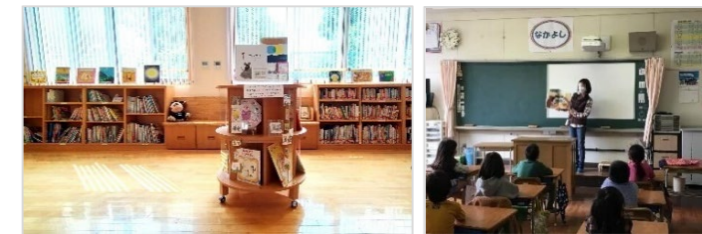
本の貸出は月～土曜の9時30分～16時30分 小学校のクラスで読み聞かせ