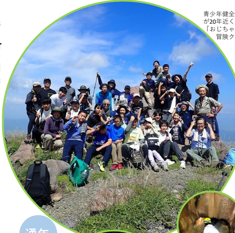
青少年健全育成連合会が20年近く行っている「おじちゃんと一緒に冒険クラブ」