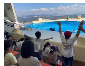
子育て連主催のマリンワールド訪問(令和4年10月)

●子ども会&子育て連の催し 東箱崎校区には4つの子ども会があり、それぞれに季節行事やラジオ体操、廃品回収などの活動を行っています。また「子ども会育成連合会」では、校区在住の子どもたちを対象にしたイベントを年数回開催しています。