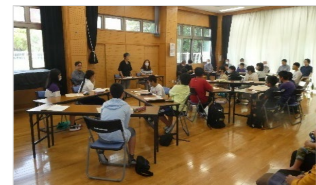
オリエンテーション・事前研修で注意点や役割分担を確認

遊びを通して子どもの生きる力を育むことを目的とした冒険クラブ。小学4年生から6年生の希望者を対象として、地域の大人と子どもと一緒に年間通してさまざまな活動を行います。令和5年度は鍛錬登山、沢のぼり、キャンプ、洞窟探検、耐寒活動などを実施。楽しいだけでなく、仲間と力を合わせて危険や困難を乗り越えることで、たくましく成長した子どもたちの姿が見られます。