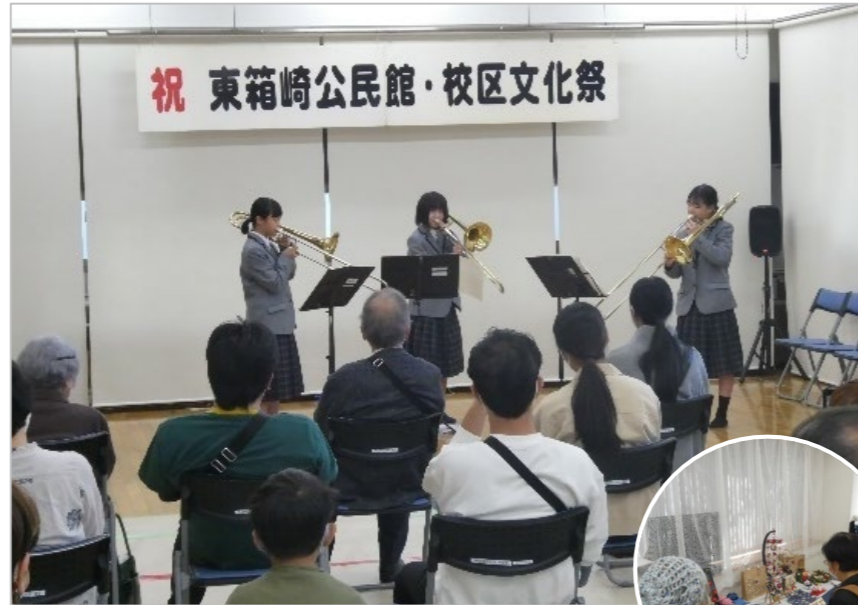
箱崎中学校吹奏楽部のアンサンブル演奏