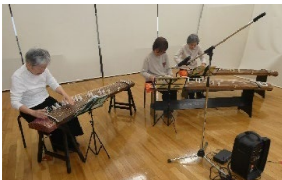
琴、リコーダー、合唱、ギター、吹奏楽などのステージ

九州大学百人一首愛好会の学生さんを講師に招き、毎年10月から1月まで全7回の教室を開催。小学1年生から大人まで参加でき、百人一首のいろいろな遊び方やルールを教わります。1月下旬に開かれる「新春かるた会」では、教室の修了生と先生、一般参加も交えて、熱戦が繰り広げられます。