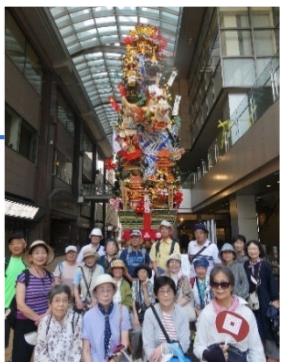
7月は博多祇園山笠めぐり

年10回開催される「月いち健康ウォーク」は、毎回20名ほどが参加し、福岡市近郊、県外まで足をのばして町歩きを楽しみます。