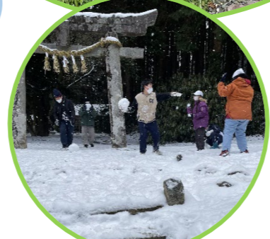
耐寒キャンプで雪合戦