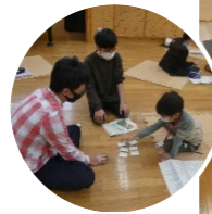
坊主めくり、ちらし取り、競技かるたなどで得点を競う「新春かるた会」