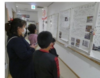
東箱崎小学校3年生の作品展示

例年11月の第1日曜日に開催。公民館サークルの活動発表や作品展示、地域団体の実績紹介、飲食バザー、フリーマーケットなどが行われます。東箱崎小学校3年生の作品展示、東箱崎中学校の吹奏楽部による演奏も楽しめます。