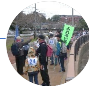
道中、スタッフが名所旧跡の歴史などについて説明

毎年3月に行われる健康づくり委員会主催のウォーキング大会。春風を感じながら自然の中をのんびり散策します。令和5年度は「お花見6キロコース」で実施。校区在住なら誰でも申し込みでき、毎年200名近い参加があります。