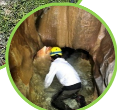
五感を使って洞窟体験!