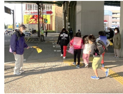
国道3号線沿いの危険なポイントで見守り